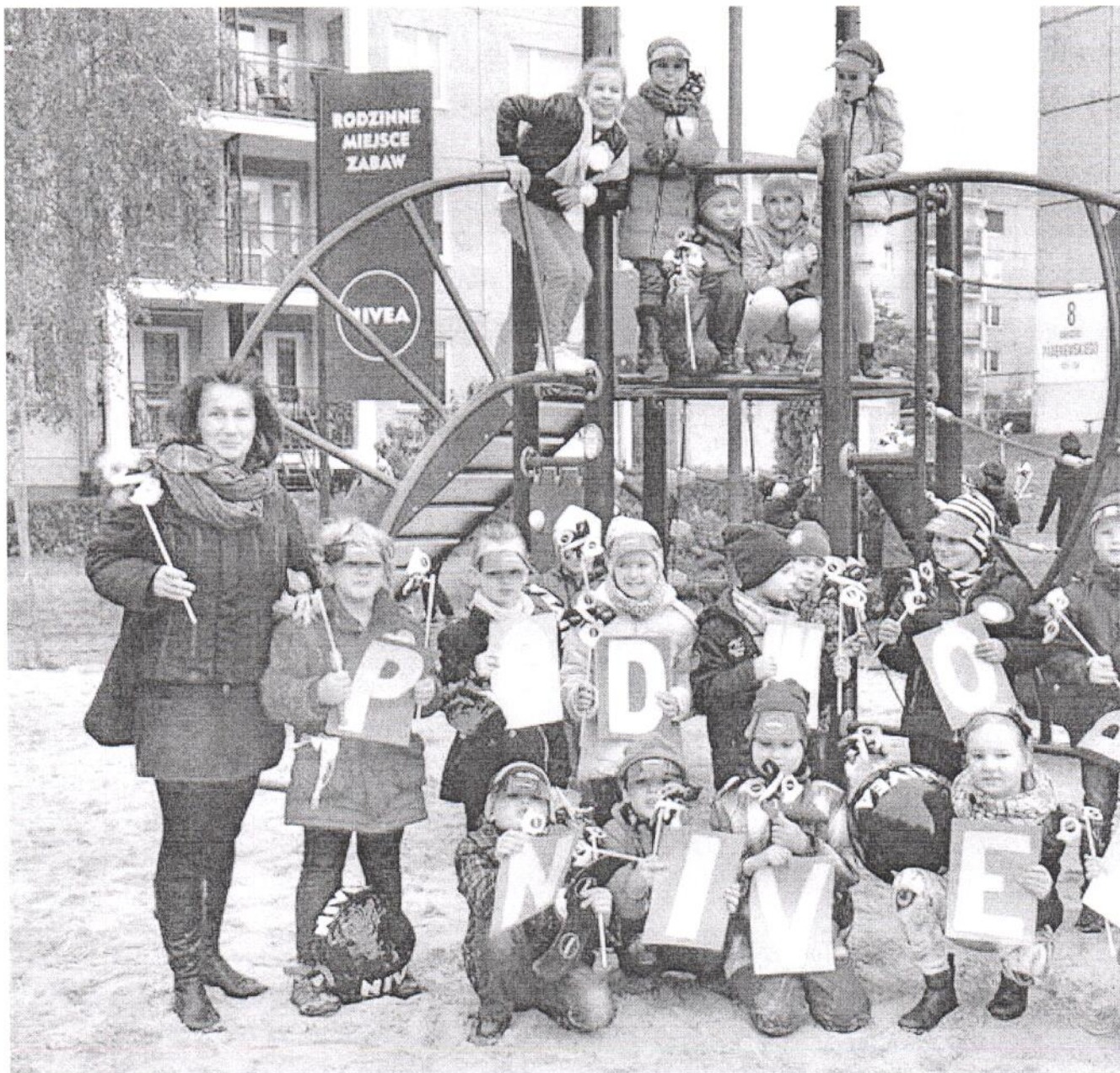
Trzemieszno--_Zdjecia2 z otwarcia_NIVEA_P_2015 (4).jpg