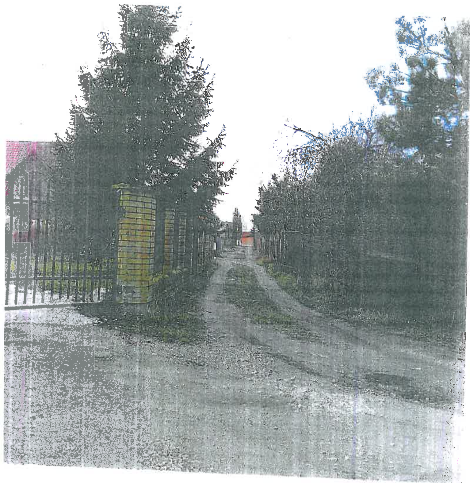
Brak oświetlenia ul. Łąka Kunice